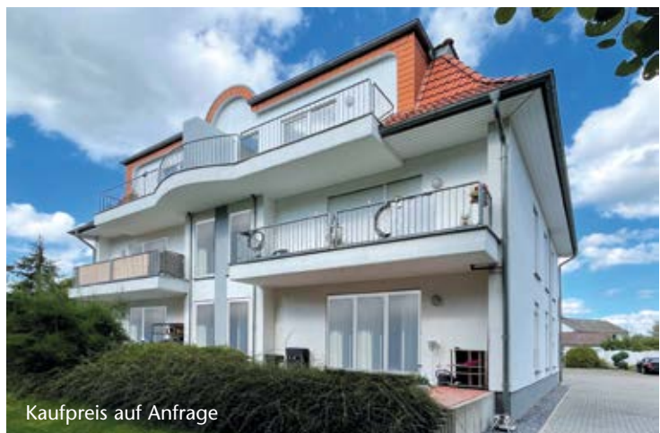
Kaufpreis auf Anfrage

Das hier präsentierte Mehrfamilienhaus, erbaut im Jahr 1998 steht in einer angenehmen und ruhigen Stadtrandlage von Minden und bietet eine sehr gute Infrastruktur in der direkten Umgebung. Die Entfernung zum Stadtzentrum beträgt lediglich ca. 3,8 Kilometer, was eine optimale Verbindung zwischen urbanem Leben und Ruhe gewährleistet.